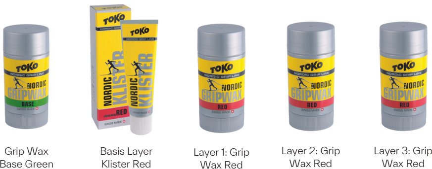
Grip Wax Base Green