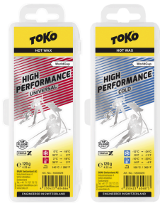
HP Hot Wax Universal and Cold